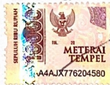
Ivankanovic Rachmanov Kalasky