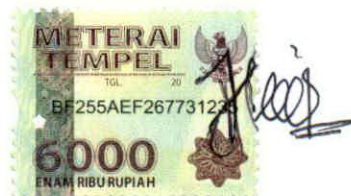
Dwi Naili Fikriyah