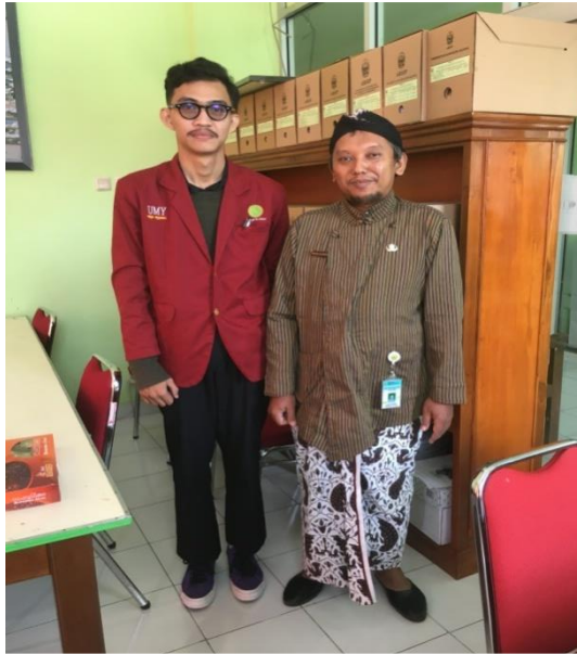
Lampiran 7: Wawancara Penelitian Dinas Pertanahan dan Tata Ruang.