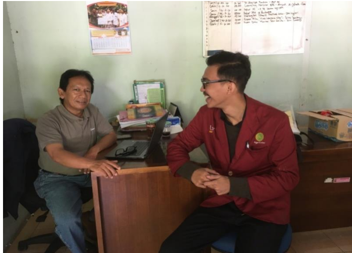
Lampiran 11: Wawancara Penelitian Kecamatan Banguntapan