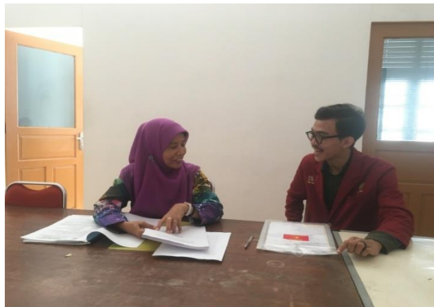
Lampiran 2: Wawancara Penelitian Dinas Pekerjaan Umum Perumahan dan Kawasan Permukiman.