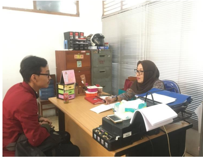
Lampiran 5: Wawancara Penelitian Dinas Pekerjaan Umum Perumahan dan Kawasan Permukiman.