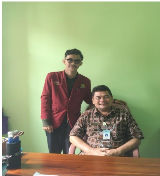
Lampiran 8: Wawancara Penelitian Dinas Pertanahan Dan Tata Ruang.