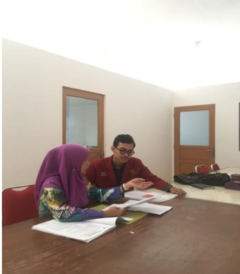
Lampiran 3: Wawancara Penelitian Dinas Pekerjaan Umum Perumahan dan Kawasan Permukiman.