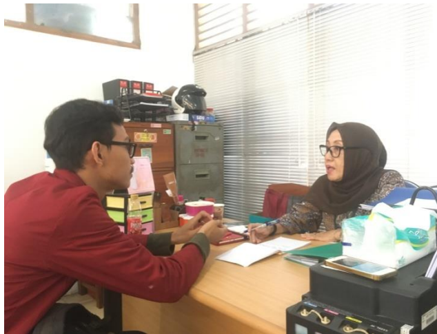
Lampiran 4: Wawancara Penelitian Dinas Pekerjaan Umum Perumahan dan Kawasan Permukiman.