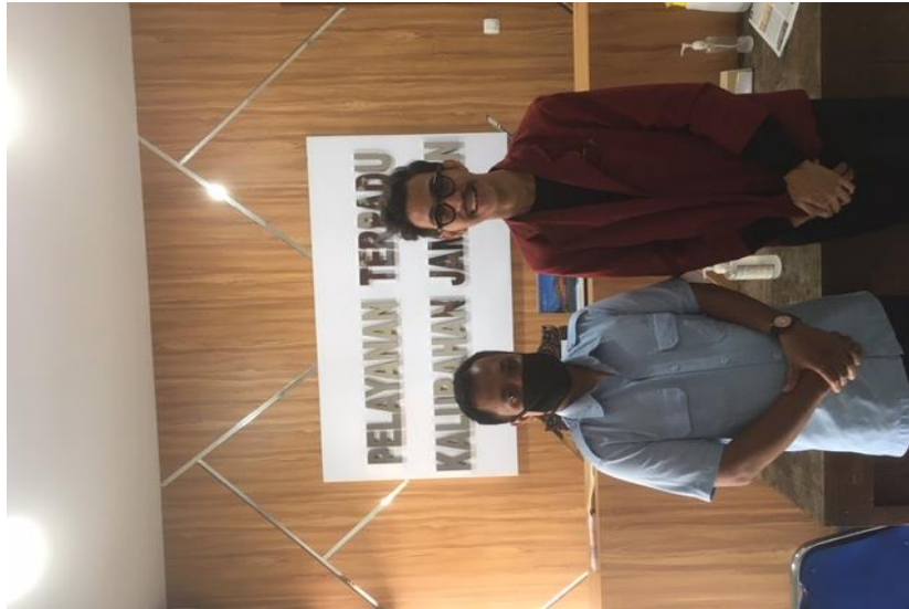
Lampiran 16: Wawancara Penelitian Kantor Desa Jambidan