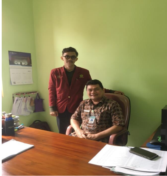
Lampiran 9: Wawancara Penelitian Dinas Pertanahan dan Tata Ruang