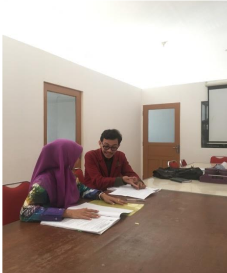
Lampiran 1: Wawancara Penelitian Dinas Pekerjaan Umum Perumahan dan Kawasan Permukiman.