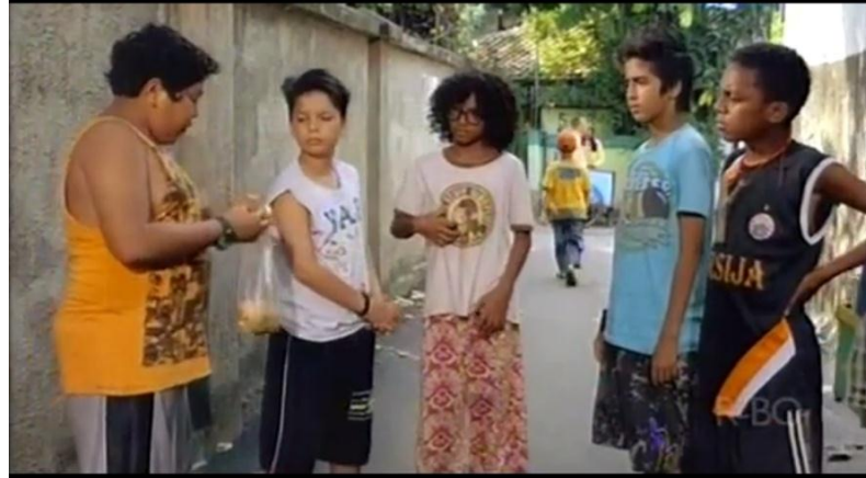
Gambar 2. Scene Raja dan keempat temannya

Peran dan karakter yang sama terlihat juga dalam film lainnya, yakni film Nagabonar Jadi 2 (produksi tahun 2007). Film ini menceritakan tentang kasih sayang antara seorang ayah dan anaknya. Tokoh Batak yang sangat menonjol di film ini adalah tokoh si ayah yang bernama Nagabonar. Meskipun tokoh Nagabonar yang diperankan oleh aktor terkenal Deddy Mizwar digambarkan sebagai mantan pejuang Indonesia, tetap saja terdapat sisi negatif yang dilekatkan pada tokoh Batak ini, yaitu Nagabonar diposisikan sebagai seorang mantan pencopet di Medan yang keluar-masuk penjara Jepang.