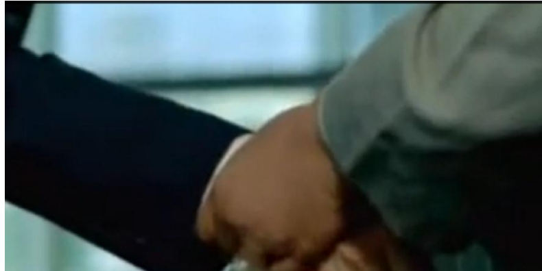
Gambar 3. Scene Nagabonar diam-diam mencopet jam tangan pengusaha Jepang saat mereka berjabat tangan