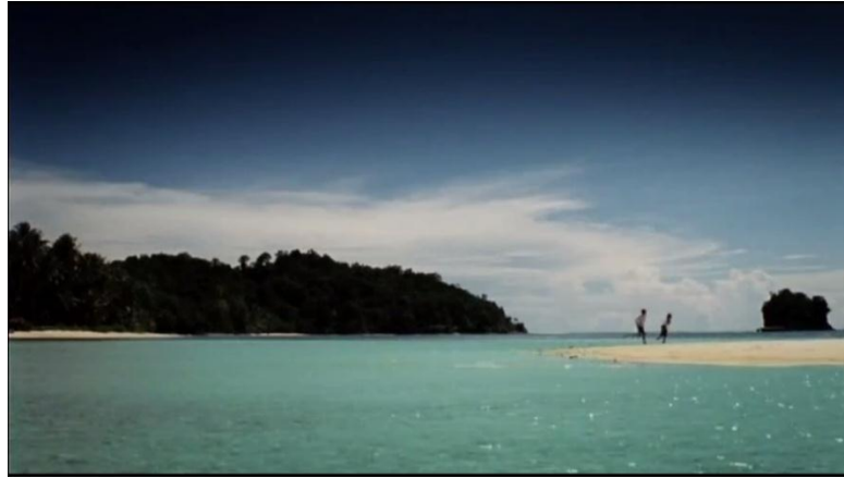
Gambar 6. Scene keindahan pantai di Pulau Mursala