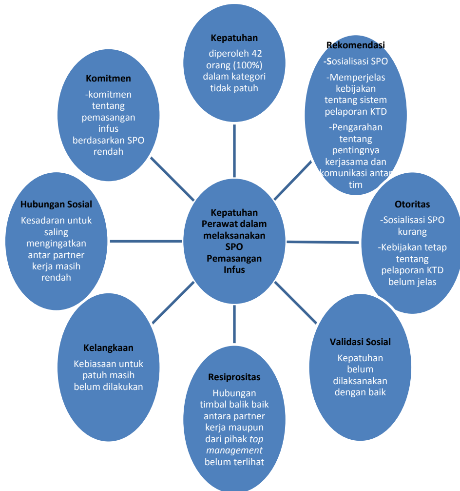
Gambar 1. Bagan Hasil Keseluruhan Wawancara Mendalam