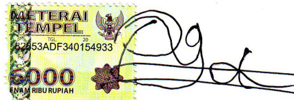
Raga Bangun Pradana