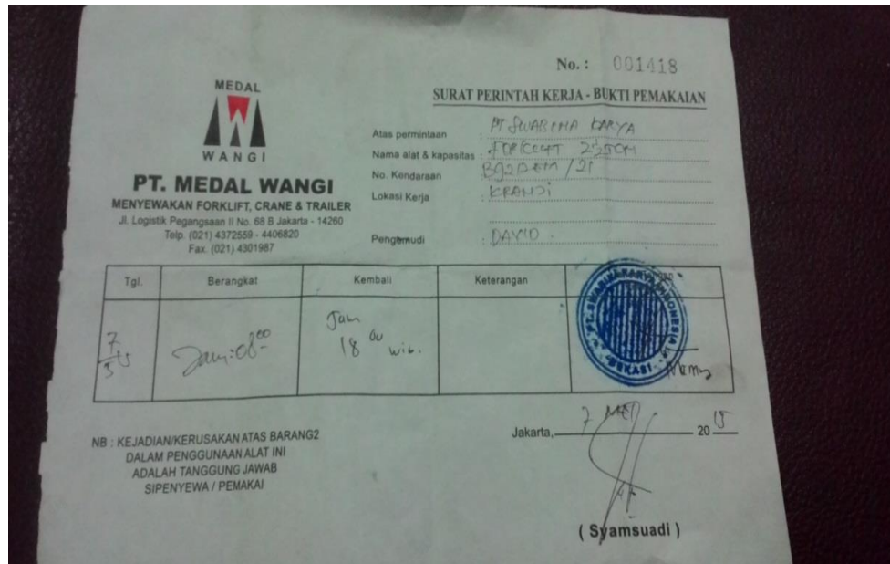
Gambar 1.1 Surat jalan perusahaan PT MEDAL WANGI

dikembalikan. Dibawah ini merupakan contoh kuitansi dan surat jalan yang masih menggunakan sistem manual (Gambar 1.1 dan gambar 1.2 )