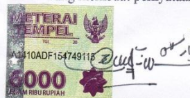
Aris Bahrudin Siregar