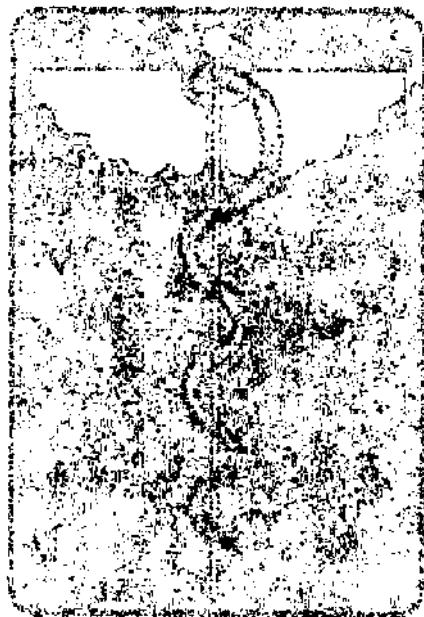
Рис. 1. Вид документа

4. Прочитайте текст и выполните задание. Вставьте пропущенные слова, выделите грамматические основы. (10 баллов)