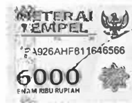
Prasetyo Adi Nugroho