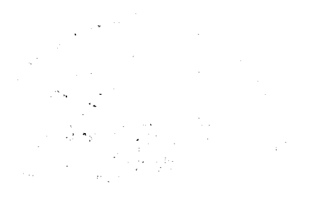
Diagram illustrating the geometry of a circular path.