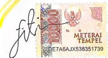
Fitria Wahyu Nurfadillah