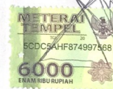
Ilham Qahhar Aziz Nursito

Yogyakarta, 13 Januari 2021 Yang membuat pernyataan,