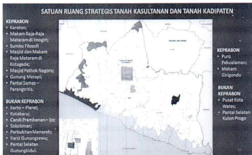
Gambar 2 : Satuan ruang strategis tanah Kasultanan dan Kadipaten