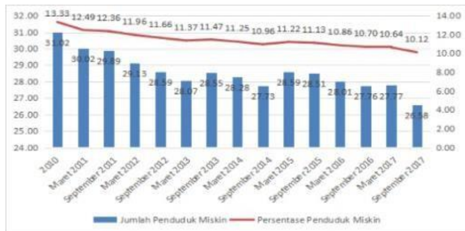
Gambar 1.1 Kemiskinan Indonesia 2010-2017