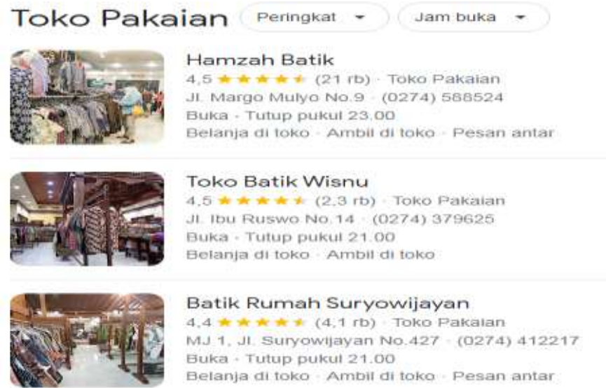
Gambar 1.2 Rating Toko Batik di Jogja

Berdasarkan gambar 1.2 menunjukkan bahwa Hamzah Batik berada di posisi pertama dengan rating sebesar 4,5 dengan review dari 21 ribu konsumen. Kemudian di posisi kedua yaitu Toko Batik Wisnu dengan rating yang sama yaitu 4,5 tetapi berdasarkan review dari 2,3 ribu konsumen, lebih sedikit dari Hamzah Batik. Maka dapat disimpulkan bahwa Hamzah Batik menjadi toko dengan rating terbaik menurut para konsumen.