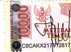
Muhammad Reza Pahlevi