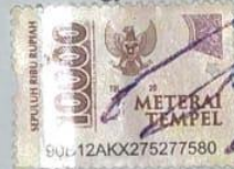
Zenuar Dwi Armanto