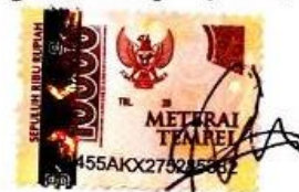
Tazkia Nurul Izzah