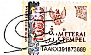
Tyas Abdi Pangesti