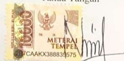
Nazwa Nur Ashyfa