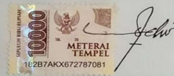
Dwi Putro Wibowo Laksono