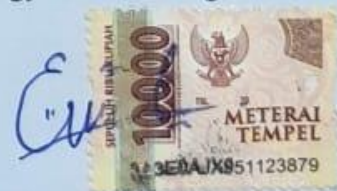
Endah Nur Kholifah