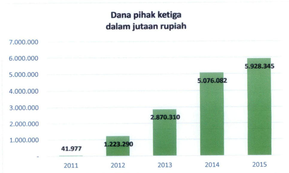
grafik 1.1 Pertumbuhan Dana Pihak Ketiga pada Bank Panin Syariah

Sumber data : laporan tahunan bank panin dubai syariah tahun 2014. Diakses Tanggal : Senin, 26 Desember 2017 : 11.00