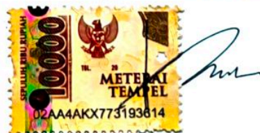
Nurul Izzah Azzahari