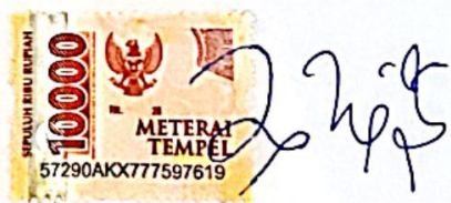
Ashfi amalina risqi