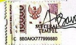
Halimatus Fadilah Sekar Arum