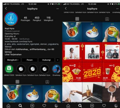
Gambar 1 - Instagram Kopi Hyra

Berikut foto Instagram milik kompetitor Kopi Hyra :