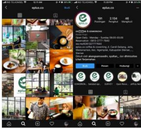
Gambar 2 - Instagram Eplus (kompetitor)