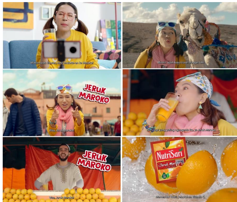
Gambar 6 - Iklan Nutrisari dengan judul “Mimin Jeruk Maroko”