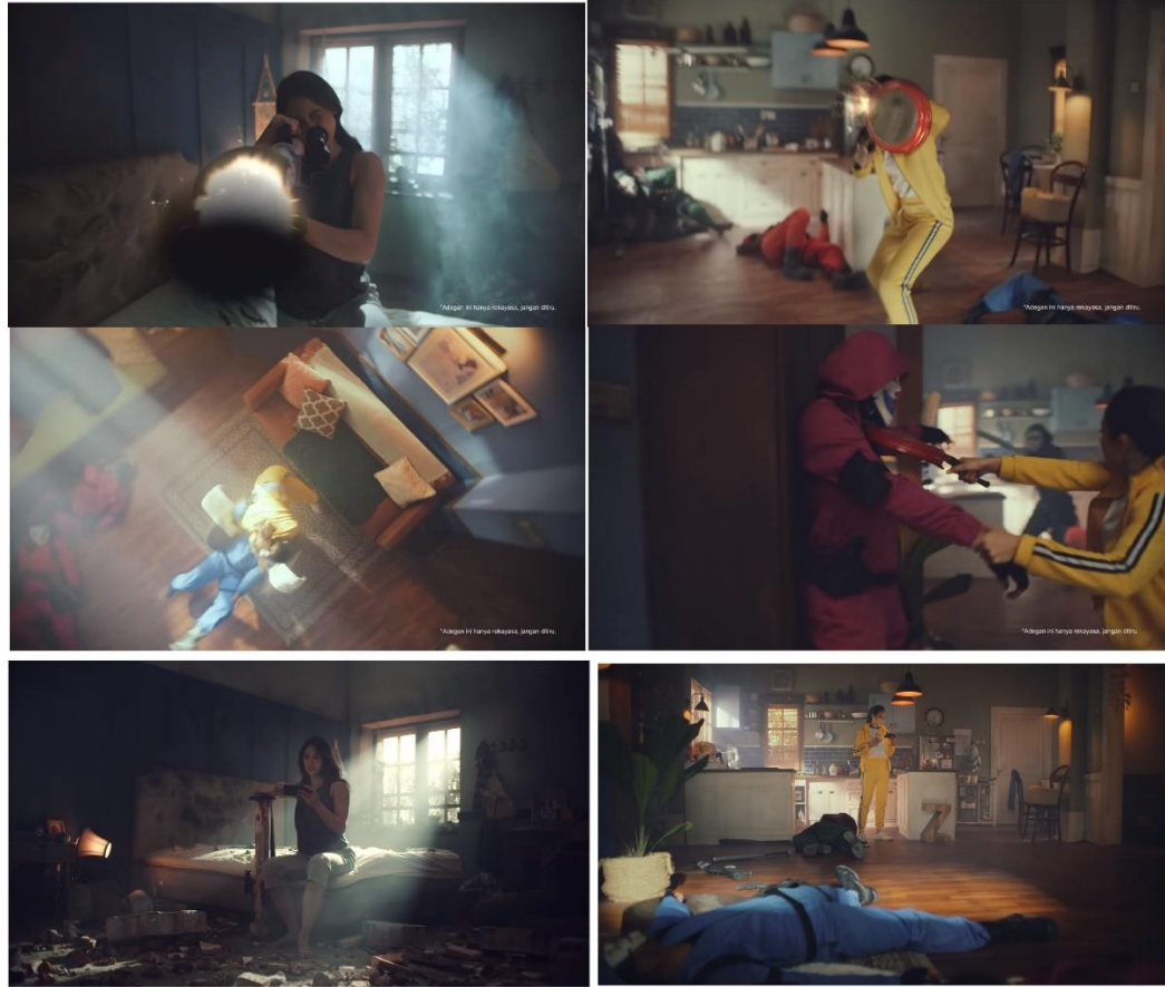
Gambar 5 - Iklan Gojek “Skin Baru Pevita Heboh”