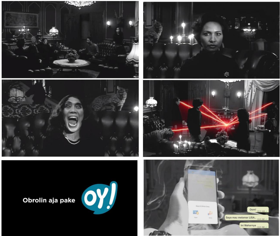
Gambar 7 - Iklan Oy dengan judul “Mau Ngelamar Cewek”