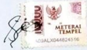
Sovia Nabila Aqmar