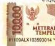
Adilla Ainun Salsabila