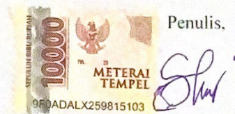
Salha Farhaniah Bouty