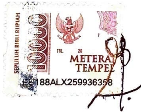
Ikrima Said Sabri