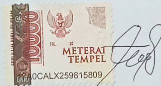
Arwin Setiya Dewangga

Yogyakarta, 1 April 2024 Yang membuat pernyataan,