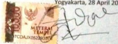
Deasy Dwi Miranti