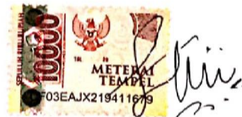
Ehni Kicy Sukinah Situmorang