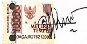
Ara Dwi Anggraeni