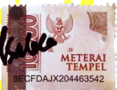
Almas Farhah Salsabila