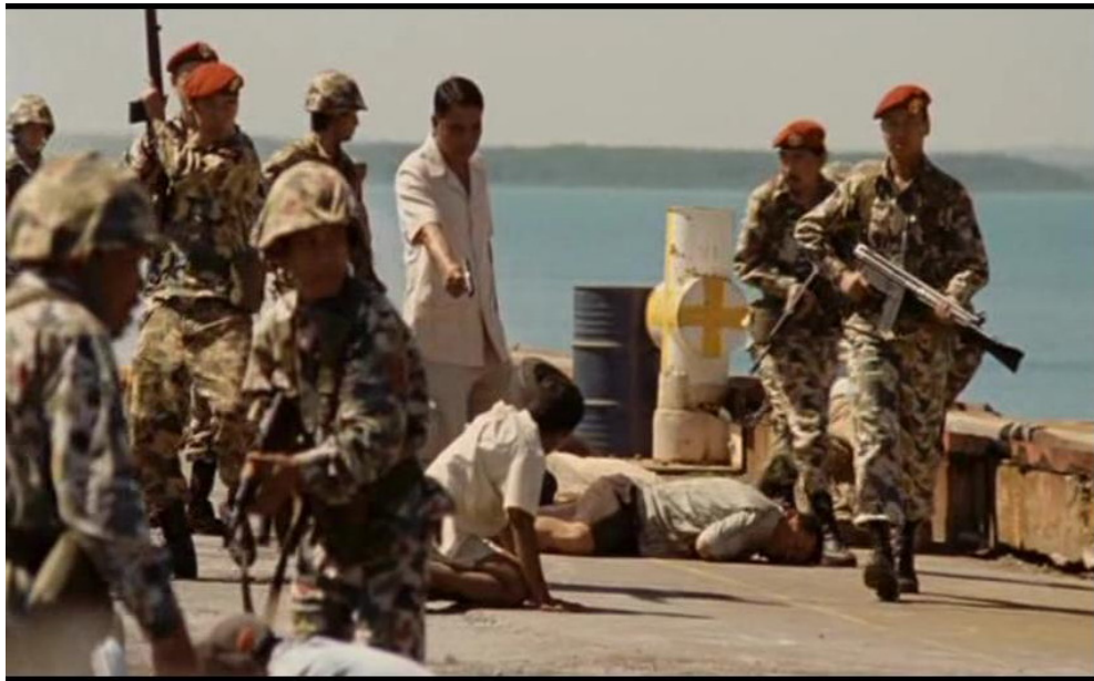
Gambar 2. Scene kekerasan militer terhadap sipil. Militer Indonesia digambarkan menggunakan seragam militer dengan baret merah dan seorang lagi menggunakan pakaian safari, menggunakan senjata laras panjang dan pistol melakukan intimidasi dan penembakan terhadap warga sipil.

Indonesia mendukung kemerdekaan Papua. (Gatra edisi 21 senin 3 April 2006). Australia tercatat pernah memberikan suaka kepada 42 warga Papua yang meminta perlindungan di negaranya setelah peristiwa Abepura.