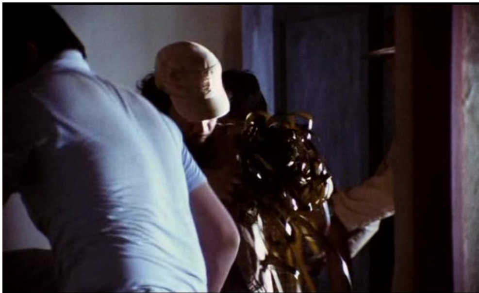
Gambar 1. Scene kekerasan militer terhadap jurnalis. Tentara Indonesia dengan pakaian preman menghancurkan rekaman hasil liputan wartawan untuk mencegah Informasi keluar dari Timor Leste.

peristiwa 1975 adalah dianggap sebagai awal dari integrasi East Timor dengan Negara Kesatuan Republik Indonesia. Militer digambarkan membunuh banyak warga sipil serta melakukan pengrusakan terhadap infrastruktur misalnya pengrusakan terhadap property Hotel Turismo, serta melakukan intimidasi dengan membuat sipil merasa takut dan terancam dengan membentak dan menodongkan senjata. Dalam film ini juga pemerintah Indonesia juga digambarkan berusaha menutupi arus informasi yang keluar dari Timor Leste dengan menghancurkan rekaman hasil liputan wartawan.