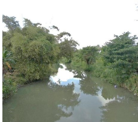
Gambar 1.1 Lokasi penelitian pada Sungai Code pias Jembatan Pandeyan

Dalam upaya mengetahui seberapa besar pencemaran air yang terjadi pada Hilir Sungai Code, maka dilakukan penelitian kualitas air pada Hilir Sungai Code dengan menggunakan Indeks pencemaran menurut KMNLH No. 115 Tahun 2003 tentang pedoman penentuan status mutu air dan Indeks Kualitas Air- National Sanitation Foundation (IKA-NSF) sedangkan dalam analisis pergerakan angkutan sedimen menggunakan metode Meyer-Peter and Muller (MPM) , Frijlink dan Einstein . Pada penelitian ini analisis kualitas air dan angkutan sedimen dilakukan dengan mengambil contoh air dan sedimen langsung dari sungai. Lokasi dari penelitian ini terletak pada pias jembatan Pandeyan, pias jembatan dekat MTs Negeri 1 Bantul dan pias jembatan Ternak Kuda Ponggok 2.