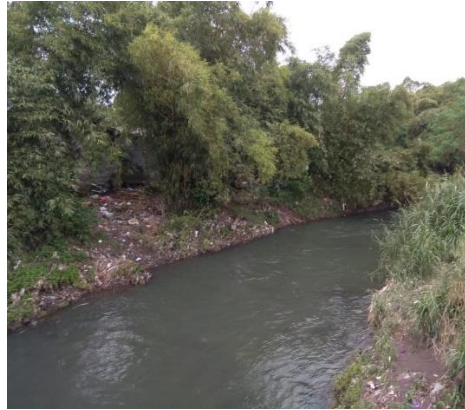
Gambar 1.3 Lokasi penelitian pada Sungai Code pias Jembatan Ternak Kuda Ponggok 2