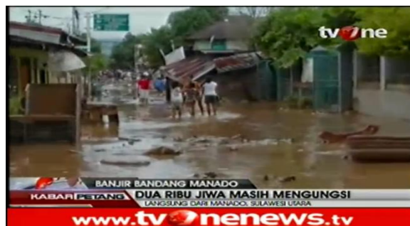
Gambar 1.2. Banjir Manado

Sejauh ini dari pantauan kami sampai saat ini warga di sejumlah kecamatan masih terus berupaya membersihkan rumah mereka yang dilanda banjir bandang yang terjadi kemarin, selain itu juga sebagian warga mengungsi dan mengenai korban jiwa setelah sebelumnya di kabarkan ada 13 korban meninggal dunia, namun data terbaru yang kami terima korban jiwa akibat bencana banjir bandang dan tanah longsor yang terjadi di Manado dan sekitarnya sudah berjumlah 15 orang, dan dari 15 orang ini ada 2 diantara hilang dan sementara itu untuk wilayah Manado dan sekitarnya ada sedikitnya 2000 warga yang sampai saat ini masih bertahan di lokasi-lokasi pengungsian. Dari informasi yang tersimpun menyebutkan dari 15 korban tewas tersebut itu secara rinci tersebar di Manado sebanyak 6 orang, kemudian satu hilang kemudian di Kota Pemohon ada 5 orang tewas kemudian di Minahasa ada 4 orang tewas dan 1 hilang, Kemudian ada juga 3 desa di kawasan Minahasa Utara yang sampai saat ini masih terisolir dengan jumlah warga yang diperkirakan mencapai 1000 jiwa. Sampai sejauh ini warga korban banjir masih terus berharap agar bantuan berupa obat-obatan maupun makanan siap saji agar bisa lebih cepat disalurkan kepada mereka dalam kondisi darurat seperti saat ini “ .