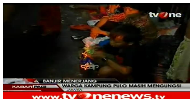
Gambar 1. 1. Banjir Jakarta

“Untuk bantuan, memang terus berdatangan seperti makanan, obat-obatan, pakaian dan lain sebagainya. Namun menurut warga mereka masih sangat membutuhkan selimut, kemudian air bersih, untuk membersihkan rumah mereka pasca banjir berikut perkakas ataupun karbo pembersih lantai, karena jika banjir telah surut rumah-rumah mereka akan dipenuhi oleh lumpur dan sampah-sampah yang mengunung ” .