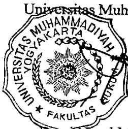
Dewi Nurul Musitari, SH., MHum. NIK: 153 027