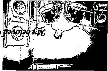
My beloved Brother (You are the best I ever had)