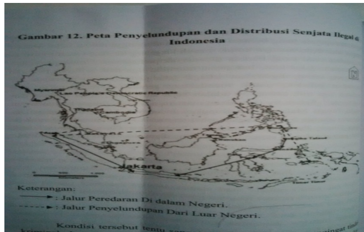
Gambar 1.4 Peredaran Senjata Gelap Di Indonesia