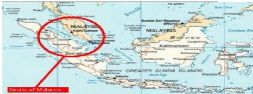
Gambar 1.5 Lokasi Terorisme Maritim di Selat Malaka

Selat Malaka merupakan wilayah perairan yang sebagian besar terbentang antara Indonesia dan Malaysia, memanjang antara Laut Andaman di barat laut dan Selat Singapura di tenggara sejauh kurang lebih 520 mil laut dengan lebar yang bervariasi sekitar 11-200 mil laut. Karena letaknya yang strategis sejak zaman kolonialisme selat malak menjadi daya tarik bagi bangsa Eropa untuk melakukan ekspansi. Selat Malaka merupakan jalur paling ekonomi untuk menuju lajur lainnya seperti Laut China Selatan, atau menuju kawasan lainnya seperti seperti Eropa, Asia Timur, dan Asia Selatan. Bahkan letak strategisnya lebih baik tiga kali lipat di banding terusan suez atau lima belas kali lipat dengan terusan panama sebagai jalur perdagangan minyak internasional. Letak yang strategis inilah yang perlu diwaspadai oleh pemerintah. Bisa dibedakan secara hukum terkait terorisisme maritim ini yang terbagi atas pembajak/perampak( sea piracy ) dan army robbery .