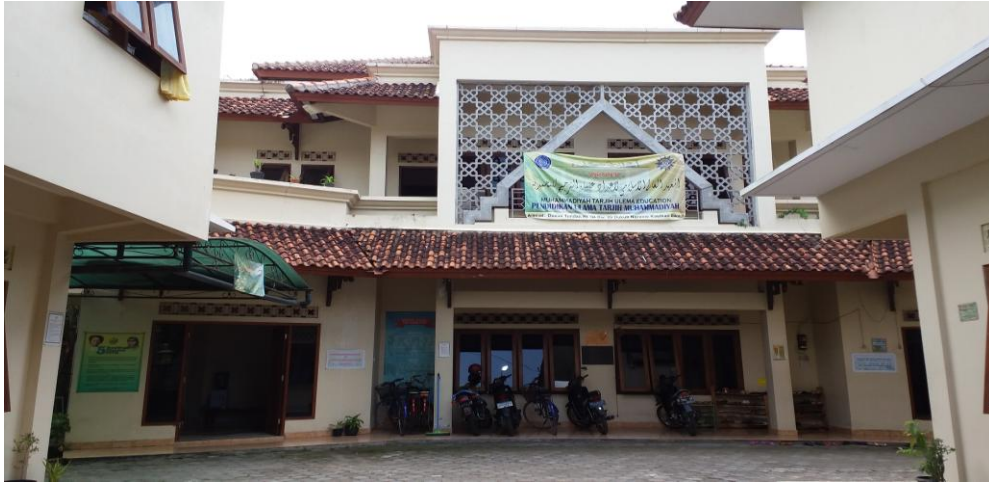
Gedung PUTM Putri