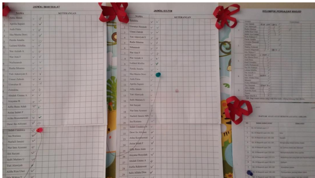
Jadwal imam salat, kultum dan kelompok pengajian masjid