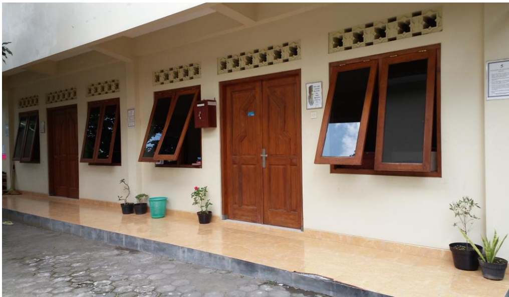
Ruang kelas PUTM Putri