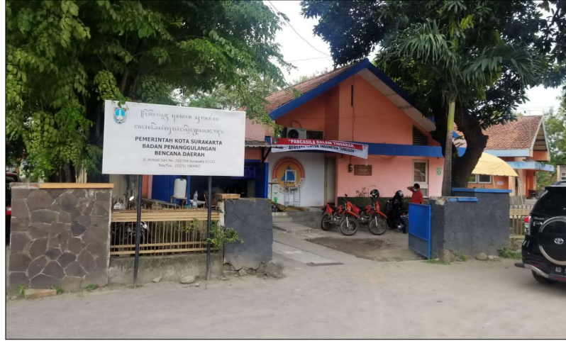
Gambar 1. 2 Kantor BPBD Kota Surakarta

Penelitian ini dilakukan di Badan Penanggulangan Bencana Daerah (BPBD) Kota Surakarta yang terletak di Jl. A. Yani No. 350-354, Manahan, Kec. Banjarsari, Kota Surakarta, Jawa Tengah 57138. Selain itu, penelitian ini juga dilakukan di wilayah Kelurahan Sewu, Kecamatan Jebres, Kota Surakarta.