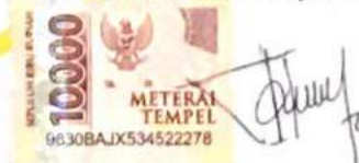
Dhea Shinta Prabandari