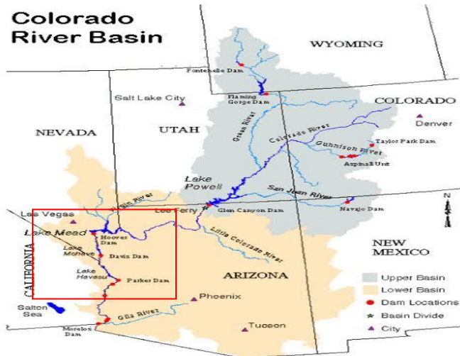
Gambar 1.2 Lokasi waduk Danau Mead

(IBWC), yang memiliki tanggung jawab dalam memberikan solusi, serta memfasilitasi permasalahan air yang timbul di kedua belah negara. Perjanjian itu menetapkan bahwa Amerika Serikat berhak menerima 350.000 acrefeet setiap tahun dari air yang mencapai Rio Grande tidak boleh kurang (Sánchez, 2006). Amerika Serikat juga harus mengirim 1,5 juta acrefeet air melintasi perbatasan setiap tahun, melalui Sungai Colorado (Snider, 2016). Pada 2007, dibawah Perjanjian 1944 Meksiko setuju untuk menyimpan airnya di resevoir (waduk) Danau Mead milik Amerika Serikat. Untuk mengontrol level air serta memastikan pemasokan air dikedua negara tersebut demi menghindari konflik (Zaragovia, 2012).