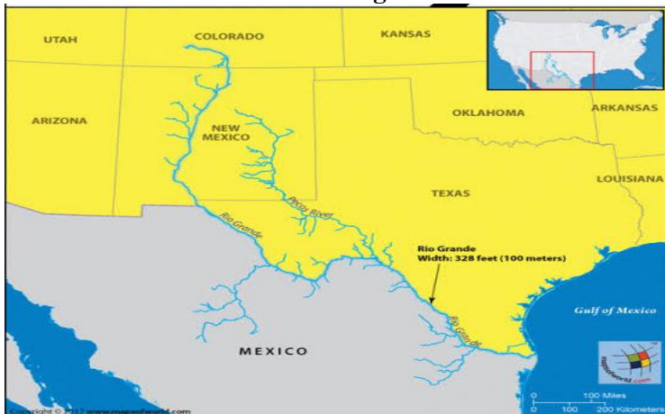
Gambar 1.1: Peta Pertbatasan antara Amerika Serikat dan Meksiko oleh sungai Rio Grande

Amerika Serikat dan Meksiko merupakan dua negara di benua Amerika yang kerap kali dihadapkan pada masalah perbatasan. Perbatasan antara Amerika Serikat dan Meksiko membentang 3.145 kilometer (1.954 mil), dari Teluk Meksiko ke Samudra Pasifik. Salah satu daerah perbatasan yang paling kuat dibentengi untuk memisahkan daerah perkotaan San Diego, di negara bagian California AS, dan Tijuana, di negara bagian Baja California di Meksiko. Perbatasan tersebut ditujukan untuk mengurangi migrasi yang berasal dari Meksiko ke Amerika Serikat (Paula Cabrera, 2013). Sungai Rio Grande dan dataran berbatu di sekitar sungai berfungsi sebagai penghalang alami, atau menjadi tanda perbatasan kedua negara tersebut (Almond, 2020). Untuk lebih jelasnya dapat dilihat pada gambar 1.1 berikut ini: