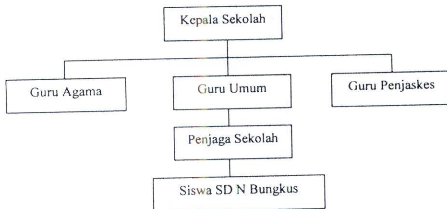
Struktur Organisasi Sekolah SD Negeri Bungkus

Struktur organisasi sekolah SD Bungkus Parangtritis Kretek Bantul Yogyakarta dibawah naungan Departemen Pendidikan Pemuda dan Olahraga, yang dipimpin oleh kepala sekolah. Seorang kepala sekolah dalam melaksanakan tugasnya dibantu oleh guru-guru dan karyawan. Adapun struktur organisasi sekolah di SD Bungkus Parangtritis Kretek Bantul Yogyakarta tergambar dibawah ini: