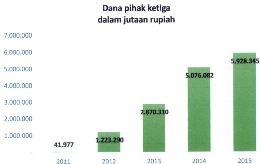
grafik 1.1 Pertumbuhan Dana Pihak Ketiga pada Bank Panin Syariah

Sumber data : laporan tahunan bank panin dubai syariah tahun 2014. Diakses Tanggal : Senin, 26 Desember 2017 : 11.00