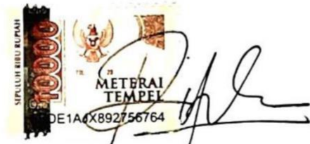
Rifda Salsabila Zahra